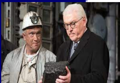
Ο Γερμανός Πρόεδρος κ. Steinmeiere

Στις 21.12.2018 σταμάτησε επίσημα, μετά από 200 χρόνια, η εξόρυξη άνθρακα στο Bottrop της BPB. Στην επίσημη τελετή παραβρέθηκαν 500 προσκεκλημένοι, ανάμεσα στους οποίους ο Πρόεδρος της Γερμανίας, στον οποίο παραδόθηκε το τελευταίο κομμάτι άνθρακα από τους εναπομείναντες 8 ανθρακωρύχους, ο Πρωθυπουργός της BPB και ο Πρόεδρος της Ευρωπαϊκής Επιτροπής. Το συγκεκριμένο