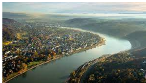
Ο ποταμός Ρήνος

μεταφοράς, που εκτοξεύτηκε εξαιτίας της χαμηλής στάθμης του νερού του Ρήνου. Άλλες εταιρείες της περιοχής, που ανακοίνωσαν παρόμοια προβλήματα ήταν η εταιρεία παραγωγής λιπασμάτων K+S, καθώς και η εταιρεία ενέργειας EnBW.