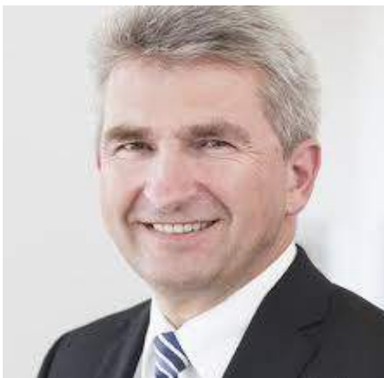
Dr. Andreas Pinkwart

Το κυριότερο ζήτημα της δημόσιας αυτής διαβούλευσης είναι πώς η ενεργειακή μετάβαση στη BPB μπορεί να επιτευχθεί μακροπρόθεσμα χωρίς ιδιαίτερα επιπρόσθετα κόστη για τους ιδιώτες καταναλωτές. (Πηγή: Report-k)