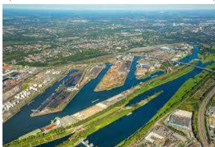
Το λιμάνι του Duisburg

Duisburg-Essen φοιτούν τη στιγμή αυτή περισσότεροι από 2.000 Κινέζοι φοιτητές, οι περισσότεροι στο Τμήμα Μηχανικών. Μέχρι τώρα οι Κινέζοι φοιτητές επέστρεφαν στη χώρα τους μετά το πέρας των σπουδών τους, κάτι που θα μπορούσε να αλλάξει με τη γενικότερη μεταβολή του αστικού τοπίου της πόλης.